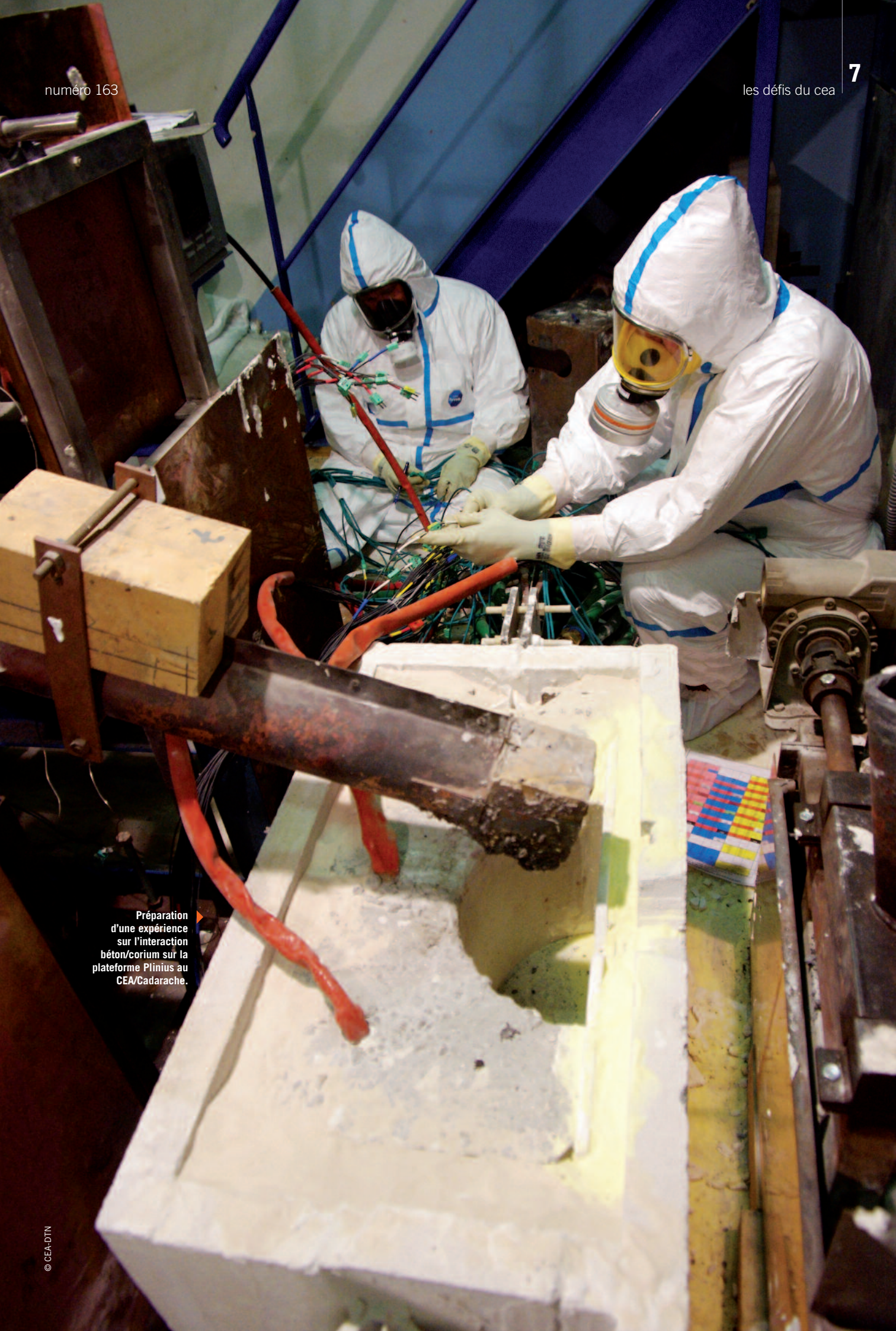
Préparation d'une expérience sur l'interaction béton/corium sur la plateforme Plinius au CEA/Cadarache.